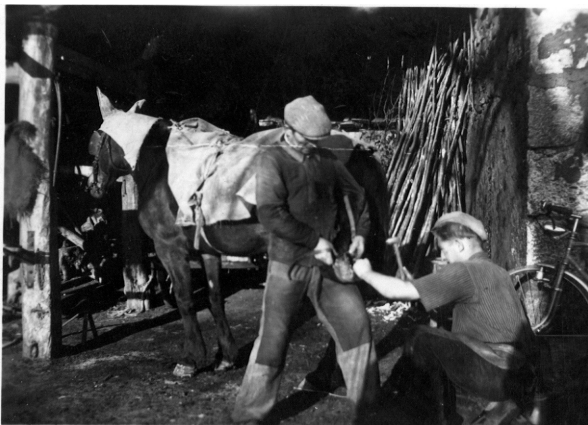
Pose du fer sur le sabot.

bête ; mais il fabriquait entièrement les fers des mulets et ceux des chevaux qui n'avaient pas " la peinture standard ". Les " clients " rendaient visite à leur maréchal environ 3 ou 4 fois dans l'année selon les travaux effectués ; ainsi les bêtes dont les propriétaires possédaient des terres au col des Prés ou des vignes aux Aymes, revenaient plus souvent. Avant 1950 les bœufs étaient les clients les plus nombreux, ensuite les mulets et les chevaux ont pris la première place, avant que les animaux de trait ne soient inexorablement remplacés par les tracteurs dans les années 60-70.