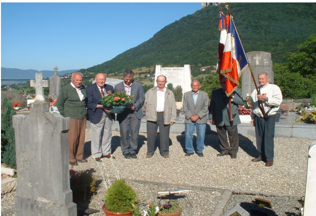
Dépose d'une coupe de fleurs au cimetière