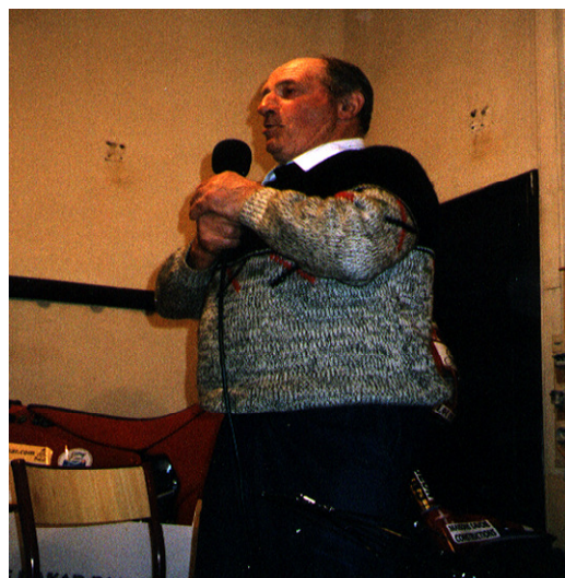
Un chanteur très applaudi

Une soirée diots particulièrement appréciée a terminé cette semaine par un moment chaleureux avec accordéon, chants et bonne humeur! Le succès de cette semaine montre que l'expérience est à renouveler plus souvent, aux beaux jours par exemple. Et d'ouvertures temporaires en ouvertures temporaires, l'espoir de voir revivre quelque chose de plus permanent est permis.