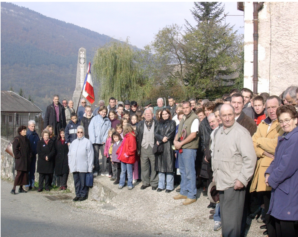
La population regroupée autour des anciens combattants devant le monument aux morts

Les habitants étaient nombreux autour du monument pour écouter la lecture du message du ministre délégué aux anciens combattants. Le moment était au recueillement lors de l'énoncé des enfants de Thoiry morts au combat. La municipalité faisait déposer une coupe de fleurs par les enfants de l'école avant la sonnerie aux morts exécutée par le clairon en titre, puis toute l'assemblée observait une minute de silence. Après quoi tous se retrouvaient à la salle Margériaz pour partager le verre de l'amitié.