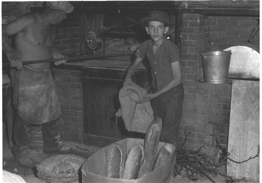
La fournée avec « Pipo » comme aide.

Il faut également parler des ménages qui allaient rarement chez le boulangier et faisaient eux-mêmes « au four », c'est-à-dire au four banal. Chaque hameau possédait un four de grande capacité permettant de cuire le pain nécessaire pour la consommation d'une famille pendant 15 jours environ. Le four n'avait pas le temps de refroidir puisque chaque famille se succédait régulièrement. Pendant la guerre, l'emploi de farine blanche était donc interdit, mais...les voyages des sacs de blé s'effectuaient souvent de nuit, avec départ le soir, 100 kilos de blé sur l'épaule jusqu'au moulin de « Bout du Monde » et retour au petit jour avec la bonne farine et le son pour les bêtes: ni vu, ni connu, par les chemins ignorés des représentants de l'Etat...Après les fournées de pain, la maîtresse de maison faisait cuire les « couëteuses », sortes de galettes plates et trouées confectionnées avec le reste de pâte raclée sur les bords du pétrin, morceaux de pain croustillant à souhait ! On n'oubliait jamais les tartes « au tatou, au bonbon ou au flan » chacun ayant son propre vocabulaire pour désigner la même sorte de pâtisserie ! Aux Chavonnettes il reste encore un four construit chez un particulier et un four alsacien qui fonctionne plus ou moins régulièrement.