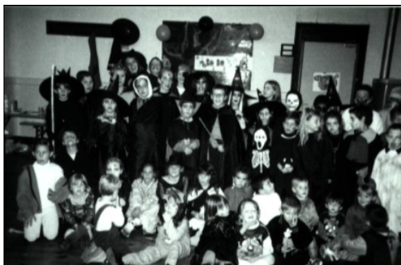
Les enfants horriblement déguisés.

Le bénéfice de cette manifestation sera destiné au financement de la classe de mer prévue au printemps prochain en Bretagne.